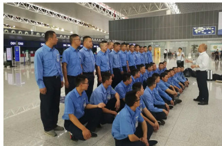
各地安维师千里驰援