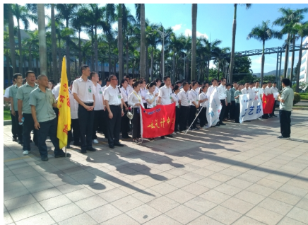
职能部门奔赴一线支援生产