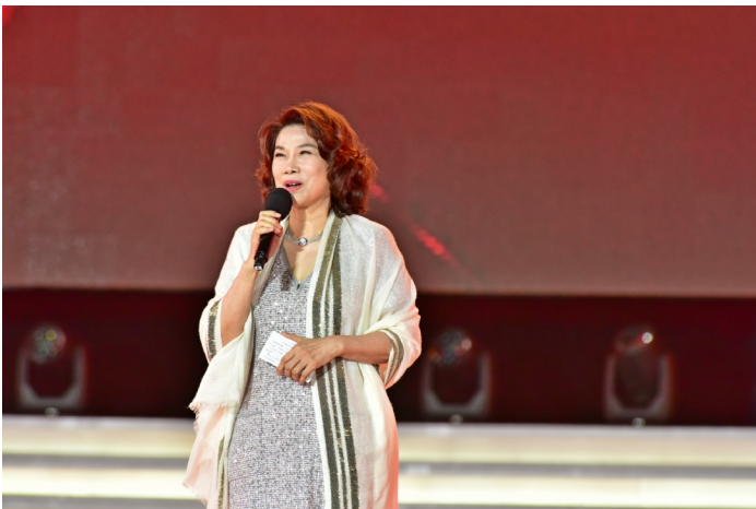
格力电器董事长兼总裁董明珠于梦想盛典现场讲话

本报讯 5月16日晚,“新时代·让世界爱上中国造——格力2018再启航”梦想盛典于珠海市体育中心举行。来自全球各地3万格力人及格力各界新老朋友欢聚一堂,共同见证格力多年自主创新的发展成果,展望格力未来发展的华彩篇章。梦想盛典上,格力电器董事长兼总裁董明珠发表了主题为“创造改变世界”的讲话,并在讲话中再“放大招”向全体员工承诺:“只要是格力人,将来一人一套房。”董明珠透露:“珠海市委市政府为了支持格力发展,已批给格力电器一万套住房的土地,我们格力人马上就有自己的房子了!”这一振奋人心的消息瞬间将现场气氛推至顶点。