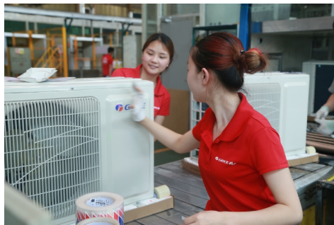
重庆格力产量再创新高

今年的夏天来得特别早，一进5月就进入炙烤状态，到了6月，空调市场更是供不应求。为保障销售，5月26日，公司发出“拼搏六月份，勇攀新高峰”的工作指示，发动全公司支援生产，全月满负荷生产30天完成生产任务，保证市场需求。