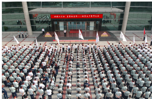
郑州格力召开旺季誓师大会