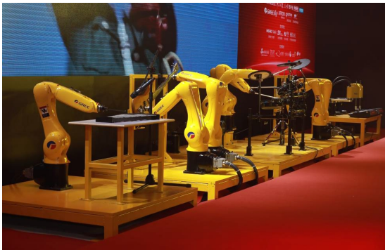
图为格力自主研发的“工业机器人乐园”

本报讯 近日举行的“新时代·让世界爱上中国造——格力2018再启航”梦想盛典上，格力再次对外发布了“工业机器人用高性能伺服电机及驱动器”、“基于G—PLC无通讯线缆的多联机系统”、“空调光储直流化关键技术研究及应用”、“全工况自适应高效螺杆压缩机关键技术研究及应用”、“地铁车站用高效直接制冷式空调机组”5项自主研发、达到“国际领先”水平的最新技术，这不仅彰显了格力的品牌实力，更充分验证了格力多年来所坚持的自主创新之路，其多元化的全球工业集团之路越走越宽。