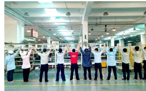
合肥格力携手旺季，勇攀高峰